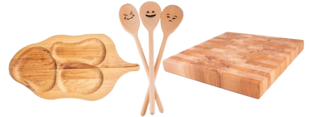
Ustensile din lemn