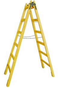
Scară de zugrav